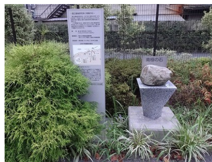
極地研移転の置き土産「南極の石」