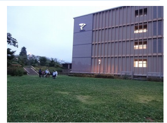
芝生の帝京大公開空地