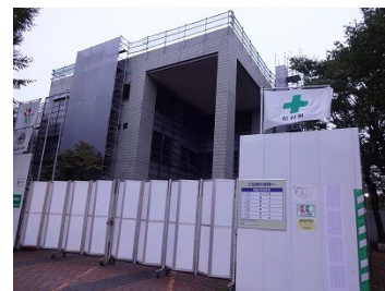
板橋東体育館は工事中

加賀のまちづくりは2017年と2018年、2019年と続けて全国レベルで表彰されました。