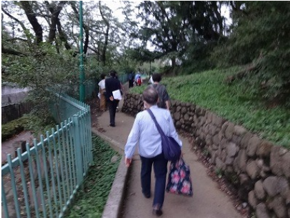
加賀公園(矢鴨の碑の向い)