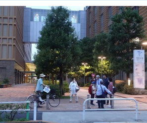
コミュニティストリートへ