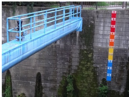
雨量が10分間で3メートル増加