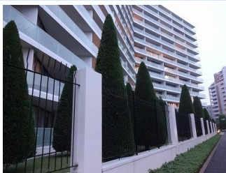
新築マンションで小学生が増えた／マンション交差点