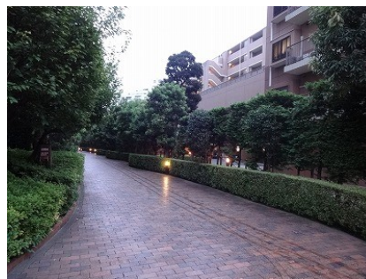
通り抜けができる・通称「けもの道」