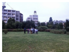
解散ミーティング

小学生や国会議員を含むメンバーでの見るだけ駆け足見学会でした。軍事施設の時代より、図書館・公園・学校・住宅などの平和利用の時代が長くなりました。予定されている史跡公園は、平和を象徴した施設になれば良いと思います。ここでの教訓を普遍化して他の地域でも応用できるヒントになればと思っています。(By 千代崎)