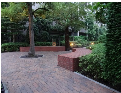
マンションの公開緑道