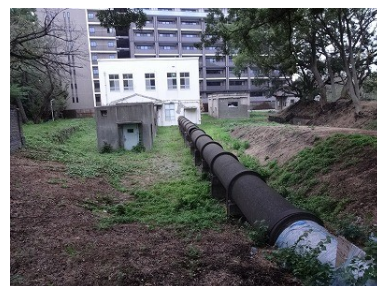
陸軍板橋火薬製造所跡

建築計画が出されて、マンションなどが建てられてしまうことを「負け」とすれば、加賀でも負け続けています。しかし、今の状況や制度の中でも、住民が主体となってまちづくりを考えて協議をして、「まちづくりを一緒に考えて欲しい」と訴え、少しずつでも協力してもらえば、何もしないより、また、黙っているよりは、確実に良くなっています。