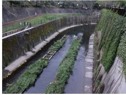
加賀橋上流の漁礁