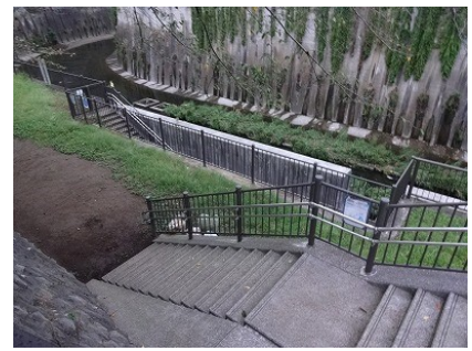
川に降りられる階段