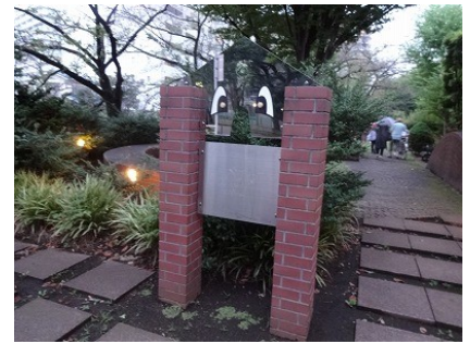
加賀一丁目みどりばし緑地