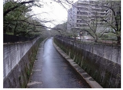
下流・右側が最新のマンション